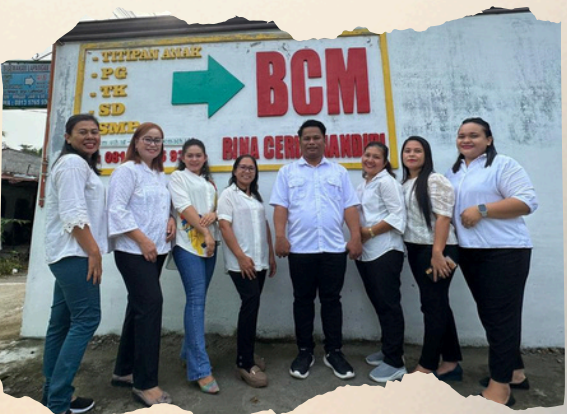
Guru SMP BCM