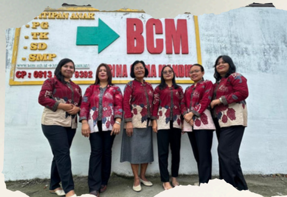
Guru PG-TK BCM