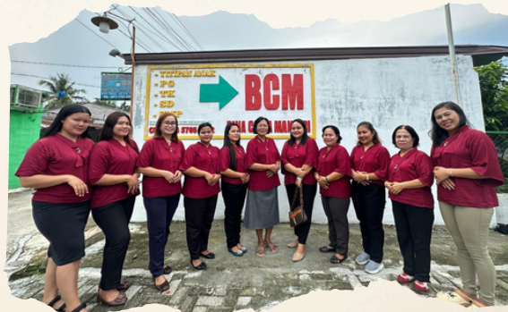
Guru SD BCM